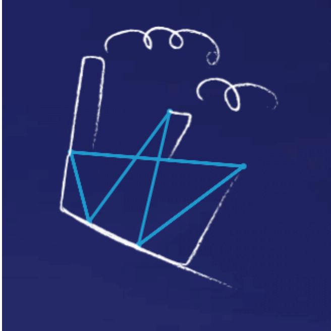
Grupa Enea została nowym właścicielem Elektrowni Połaniec

młodym, ambitnym studentom i absolwentom, którym zależy na zdobyciu unikalnego doświadczenia branżowego i rozwoju swoich umiejętności w obszarach biznesowych (m.in. techniczno-operacyjnym, administracyjno-prawnym, finansowo-księgowym, HR, IT oraz tradingowym). Po zakończeniu pierwszej edycji Zainstaluj się w Enei 70% stażystów otrzymało propozycję pracy w naszej Grupie. W kolejnej, drugiej edycji programu wzięło udział kolejnych 16 stażystów i praktykantów.