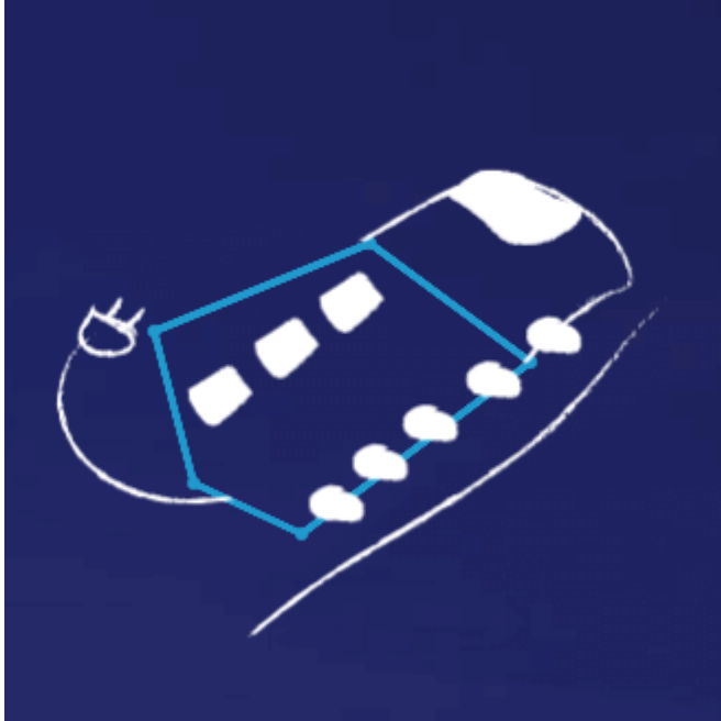
Klaster na rzecz elektromobilności

północno-zachodniej Polsce i które będzie sterowana z jednego miejsca. Taka organizacja umożliwi elastyczne, szybkie i kompleksowe reagowanie na wydarzenia występujące w całej sieci 110 kV należącej do Grupy. Zastosowane w CDM systemy informatyczne oparte są na polskich rozwiązaniach. Inwestycja przyczyni się do zapewnienia ciągłości dostaw energii elektrycznej do Klientów przez min. lokalizowanie i likwidowanie zakłóceń oraz awarii w sieci wysokiego napięcia.