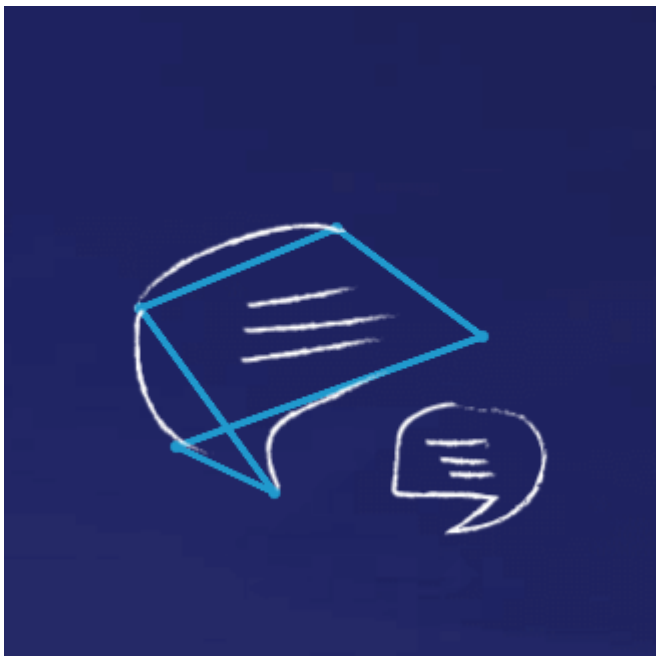
Uruchomienie internetowego chatu dla Klientów Enei

W połowie 2017 roku Enea została partnerem programu Karta Dużej Rodziny, podpisując umowę z Ministerstwem Rodziny, Pracy i Polityki Społecznej. Nowa, dedykowana dla rodzin 3+ oferta Enei to ENERGIA+ Rodzina, która skierowana jest do osób uprawnionych do korzystania z Karty Dużej Rodziny. Posiadanie Karty ułatwia dużym rodzinom dostęp do rekreacji oraz obniża koszty codziennego życia. Rodziny z co najmniej trójką dzieci, dzięki dołączeniu Enei do programu, będą mogły skorzystać ze zniżki na zakup energii elektrycznej.