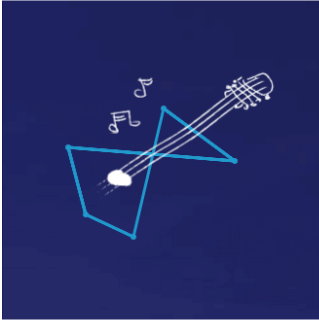
Enea Akademia Talentów

Enea Akademia Talentów to akcja społeczna, w ramach której uruchomiony został program stypendialny skierowany do utalentowanych uczniów szkół podstawowych i gimnazjalnych oraz program grantowy skierowany dla publicznych szkół podstawowych i gimnazjalnych, realizujących autorskie projekty rozwijające talenty i uzdolniania uczniów. Program dotyczył uczniów i szkół z obszaru działania spółek z Grupy Enea: uczniowie rywalizowali o stypendia w wysokości 3000 zł., a szkoły o granty w wysokości 10 000 zł. I edycja akcji trwała od września 2017 r. do stycznia 2018 r. W gronie zwycięzców znalazło się 22 młodych ludzi, 11 ze szkół podstawowych i tyle samo ze szkół gimnazjalnych. W obu kategoriach wiekowych wybrano laureatów w dziedzinie nauka, sztuka i sport. Granty na realizację ciekawych projektów edukacyjnych uzyskało z kolei 9 szkół. Program będzie kontynuowany również w 2018 roku.