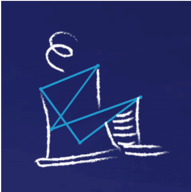
Nowy blok energetyczny B11 w Elektrowni Kozienice

W 2017 r. Grupa Enea zakończyła budowę i uruchomiła nowy blok energetyczny w Elektrowni Kozienice – blok B11 na parametry nadkrytyczne o mocy 1.075 MW. To najnowocześniejsza jednostka wytwórcza w kraju i największa w Europie opalana węglem kamiennym. Jednocześnie jest jedną z najsprawniejszych instalacji tego typu na świecie. Wzmacnia w ten sposób bezpieczeństwo energetyczne Polski. Wykorzystanie zaawansowanych rozwiązań technologii na parametry nadkrytyczne, pozwala na obniżenie emisji CO 2 o około 25% w stosunku do innych istniejących bloków opalanych węglem kamiennym.