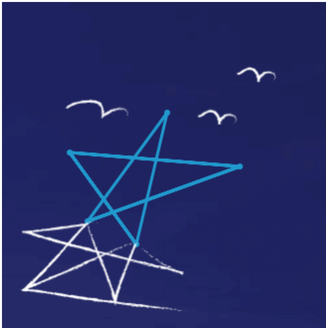
Uruchomienie Centralnej Dyspozycji Mocy

Enea Akademia Talentów to akcja społeczna, w ramach której uruchomiony został program stypendialny skierowany do utalentowanych uczniów szkół podstawowych i gimnazjalnych oraz program grantowy skierowany dla publicznych szkół podstawowych i gimnazjalnych, realizujących autorskie projekty rozwijające talenty i uzdolniania uczniów. Program dotyczył uczniów i szkół z obszaru działania spółek z Grupy Enea: uczniowie rywalizowali o stypendia w wysokości 3000 zł., a szkoły o granty w wysokości 10 000 zł. I edycja akcji trwała od września 2017 r. do stycznia 2018 r. W gronie zwycięzców znalazło się 22 młodych ludzi, 11 ze szkół podstawowych i tyle samo ze szkół gimnazjalnych. W obu kategoriach wiekowych wybrano laureatów w dziedzinie nauka, sztuka i sport. Granty na realizację ciekawych projektów edukacyjnych uzyskało z kolei 9 szkół. Program będzie kontynuowany również w 2018 roku.