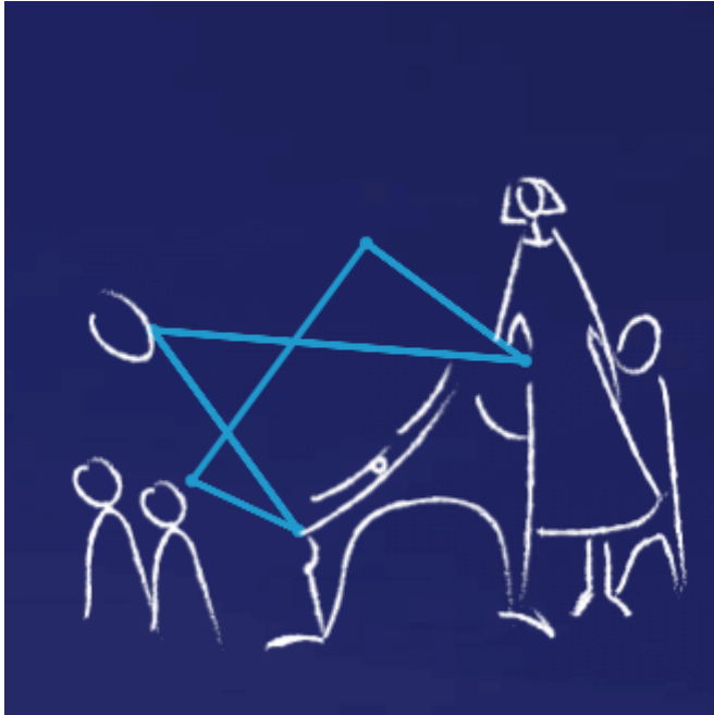
Enea partnerem programu Karta Dużej Rodziny

W połowie 2017 roku Enea została partnerem programu Karta Dużej Rodziny, podpisując umowę z Ministerstwem Rodziny, Pracy i Polityki Społecznej. Nowa, dedykowana dla rodzin 3+ oferta Enei to ENERGIA+ Rodzina, która skierowana jest do osób uprawnionych do korzystania z Karty Dużej Rodziny. Posiadanie Karty ułatwia dużym rodzinom dostęp do rekreacji oraz obniża koszty codziennego życia. Rodziny z co najmniej trójką dzieci, dzięki dołączeniu Enei do programu, będą mogły skorzystać ze zniżki na zakup energii elektrycznej.